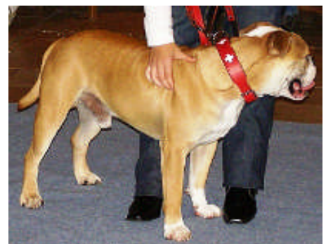
Der 'neue' Continental Bulldog

Trotz seines kräftigen Körperbaus ist der Continental Bulldog beweglich und ausdauernd, auch bei raschem Trab oder Galopp soll er geräuschlos atmen. Seine Widerristhöhe soll 40 – 46 cm und das Gewicht etwa 22—30 kg betragen.