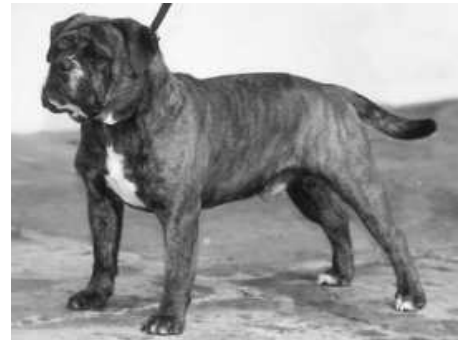
ein Bulldog alten Typs

Anders ist dies beim Continental Bulldog, hier haben sich viele Kynologen Gedanken gemacht, wie sich der Hund anatomisch verändern muss, um als Hund optimal zu funktionieren. Der ausführliche Standard beschreibt diesen neuen bulldogtypischen Hund. Probleme wie Gebissfunktionalität und Zahnfehler werden offen angegangen, der Rücken sollte nun möglichst gerade sein und nicht vorne extrem tiefer gestellt. Es sind viele Baustellen, die es gilt zu verändern und als Konsequenz ergibt dies eine neue Rasse!